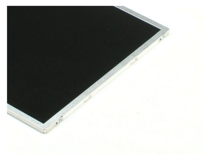
<u>חזרה לדף התוכן</u>