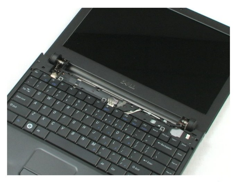
<u>חזרה לדף התוכן</u>