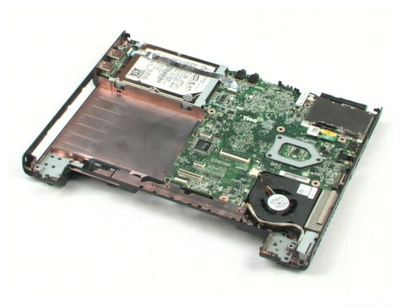
<u>חזרה לדף התוכן</u>