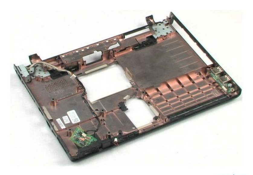
<u>חזרה לדף התוכן</u>