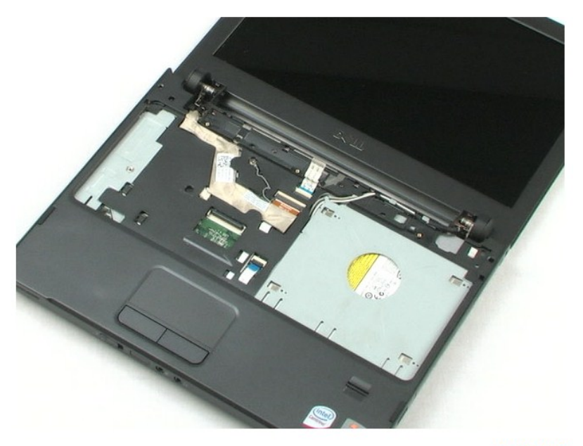
<u>חזרה לדף התוכן</u>