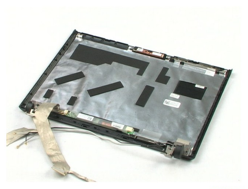
חזרה לדף התוכן