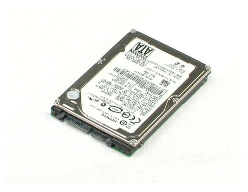
<u>חזרה לדף התוכן</u>