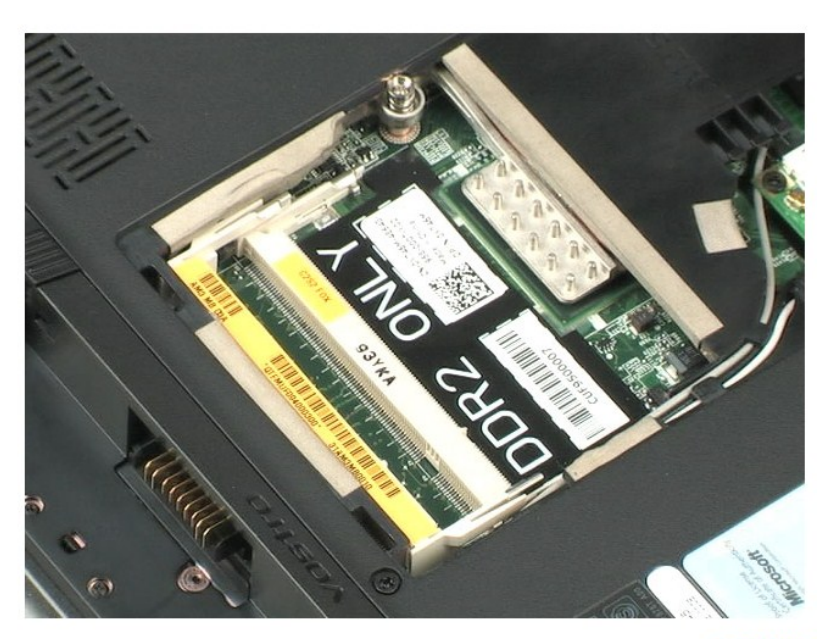
<u>חזרה לדף התוכן</u>